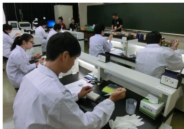
マイクロピペットを扱う選手たち