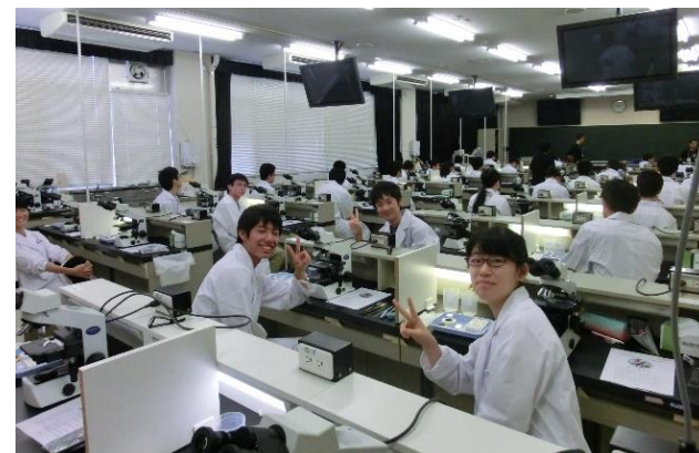
リラックスした様子の選手たち

開会式を終えた選手達は、そのまますぐに実験会場へ赴いた。実験会場について選手達は皆白衣に着替え、辺り一面は白色に包まれ少し眩しかった。試験開始を待つ選手達の様子は、ただ静かに待っていたり、近くの選手と軽く挨拶を交わしたり、キムワイプの側面を眺めたりと様々であった。しかし、試験官が試験の説明を始めると、選手達は一斉に静まり、メモを取りながら試験の準備を始めた。会場は和やかな空気から緊張した空気へと変わり、これから始まる試験に選手達は皆集中していることが伝わった。