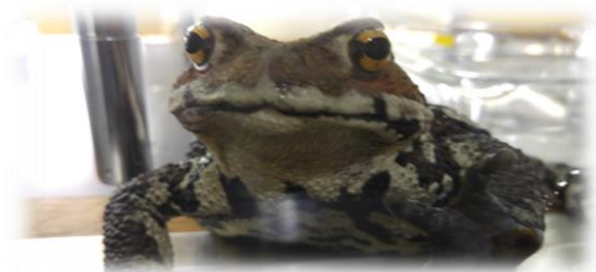
両生類研で飼育されているニホンヒキガエル

2016年に広島大学のとある研究施設に所属している研究者ら共著の論文が、英国科学誌「Nature」に掲載された。モデル生物であるアフリカツメガエルのゲノムを解読・解析した、というものである。カエル類やイモリ類など、様々な両生類の最先端研究をしているこの施設こそが、本選3日目に選手たちが見学に行く両生類研究センターである。