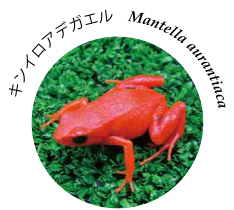
キノイロアデガエル Mantella aurantiaca