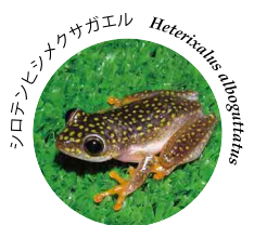
シロチンビシナクサガエル Heterixalus tibetanus