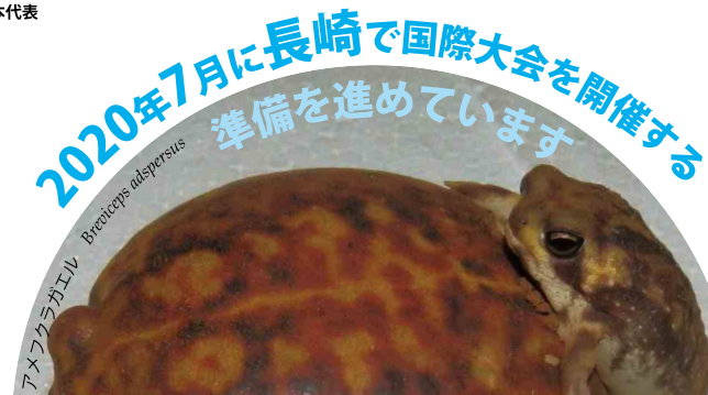
アメフクラガエル Breviceps adspersus