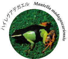
ハイレクアデガエル Mantella madagascariensis