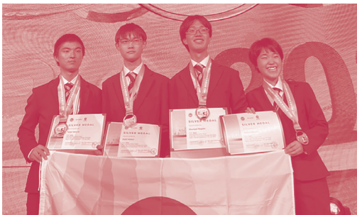
IBO2024 カザフスタン大会に出場した日本代表(2024年7月)

なお、いくつかの大学では、日本生物学オリンピックでの成績が入学試験で考慮されることがあります。(https://jbo-info.jp/admission)